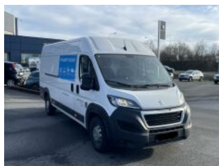
FOTO INFORMATIVNÍ. DOSTUPNOST VOZIDLA NA DOTAZ. V PŘÍPADĚ ZÁJMU VOLEJTE TEL. 777 879 119 VOZIDLO JE PRAVIDELNĚ SERVISOVÁNO V AUTORIZOVANÉM SERVISU. PRODLOUŽENÁ ZÁRUKA PVV CONFORT NA 12M.

Koupeno v CZ, První majitel, Servisní kniha