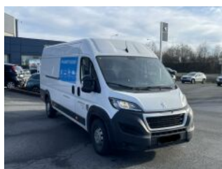
FOTO INFORMATIVNÍ. DOSTUPNOST VOZIDLA NA DOTAZ. V PŘÍPADĚ ZÁJMU VOLEJTE TEL. 777 879 119 VOZIDLO JE PRAVIDELNĚ SERVISOVÁNO V AUTORIZOVANÉM SERVISU. PRODLOUŽENÁ ZÁRUKA PVV CONFORT NA 12M.

Koupeno v CZ, První majitel, Servisní kniha